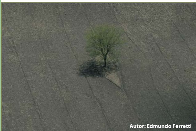
Autor: Edmundo Ferretti

La Desertificación es la degradación de las tierras de zonas áridas, semiáridas y subhúmedas secas resultante de diversos factores, tales como las variaciones climáticas y las actividades humanas.