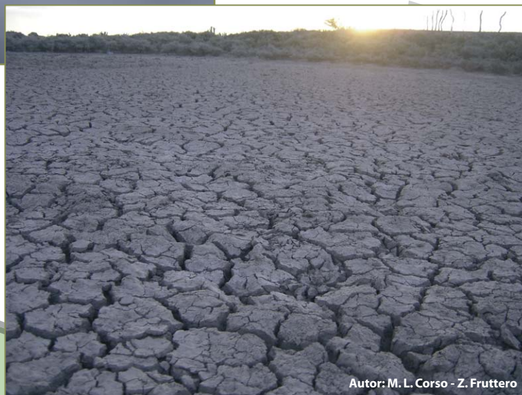
Autor: M. L. Corso - Z. Fruttero

El objetivo central del PAN consiste en luchar contra la desertificación y mitigar los efectos de la sequía, a fin de contribuir al logro del desarrollo sostenible de las zonas afectadas, todo ello con miras a mejorar las condiciones de vida de la población.