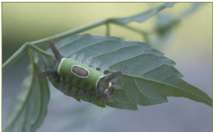
Autor: Edmundo Ferretti

Habiendo sido ratificada por la República Argentina la Convención de las Naciones Unidas de Lucha contra la Desertificación (UNCCD) elaboró el Programa de Acción Nacional de Lucha contra la Desertificación (PAN).