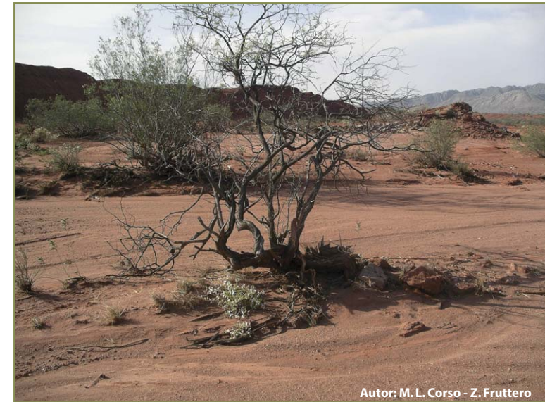
Autor: M. L. Corso - Z. Fruttero

Asimismo las 3 Convenciones Internacionales Ambientales (CDB, CMNUCC y CMNUDyS) se han comprometido a trabajar en forma conjunta en pos del desarrollo sustentable y específicamente la lucha contra la desertificación y la conservación de la biodiversidad.