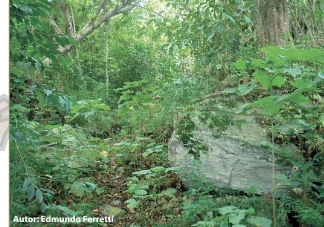
Autor: Edmundo Ferretti