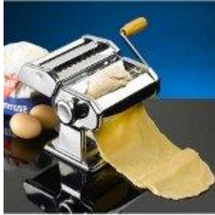
Pasta (dry) 1849 litre/kg