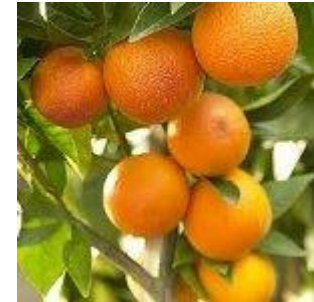
Orange 560 litre/kg