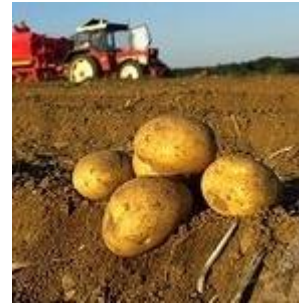
Potato 5988 litre/kg