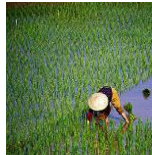
Rice 2497 litre/kg