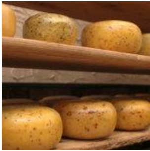
Cheese 3178 litre/kg