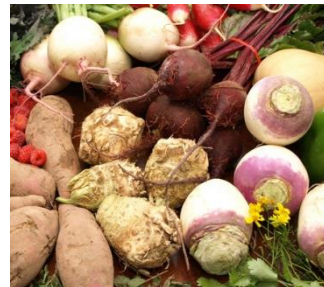
Starchy roots 387litre kg