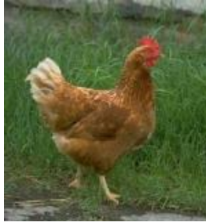
Chicken meet 4325 litre/kg