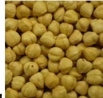
Nuts 9063 litre/kg