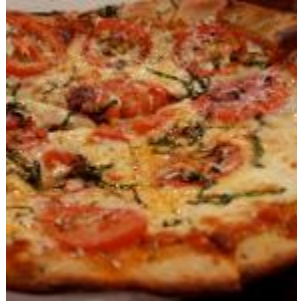
Pizza 1259 litre