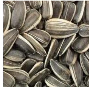
Oil crops 2364 liyre kg