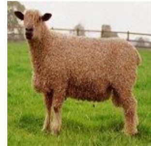
Sheep Meat 10412 litre/kg