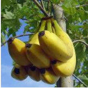
Banana 790 litre/kg