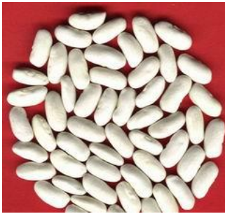
Beans 2364 litre/kg