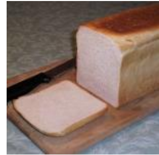
Bread 1608 litre/kg