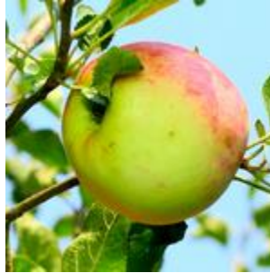
Apple 822 litre/kg