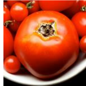
Tomato 214 litre/kg