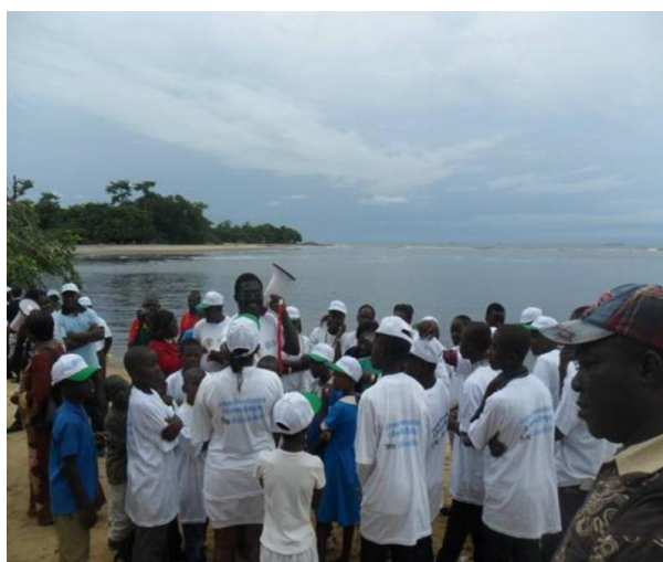
Photo 6 : Jeu de questions réponses animé par le Délégué Régional du Sud

A l'issu de ce jeu, les meilleurs ont été félicités et primés par le Ministre. Par la suite, cette séquence d'événement a été matérialisée par une photo de famille (photo6).