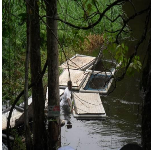
Photo 3 : dispositifs de cages utilisés par les femmes de l'OPED pour pêcher les crevettes

vendre plus chères en période où les prix sont élevés sur le marché. Il a signalé qu'une méthode d'expérimentation par un processus post-larvaire qui permettrait de mettre sur le marché des petites crevettes de quelques jours pour élevage comme cela se fait avec les poulets de chair, est en cours d'étude avec l'appui d'un expert du domaine.