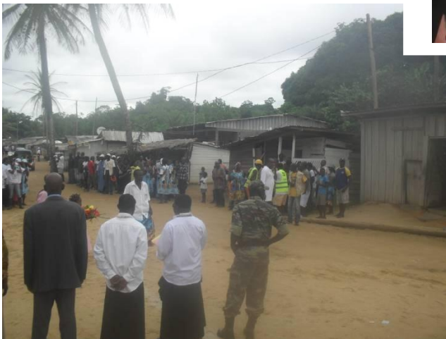
Photo7 : Accueil sur le site de Londji