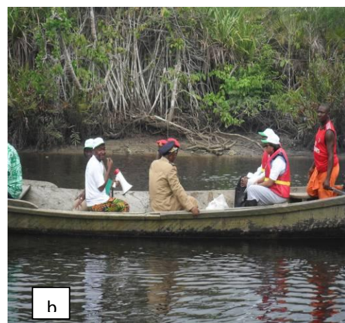
Photo 8: a et b embarcation des Ministres vers les parcelles de mangroves reboisées