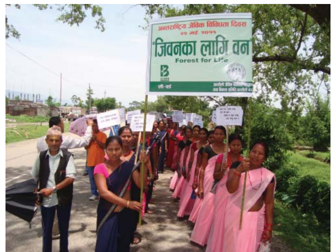
Women participating in the programme.