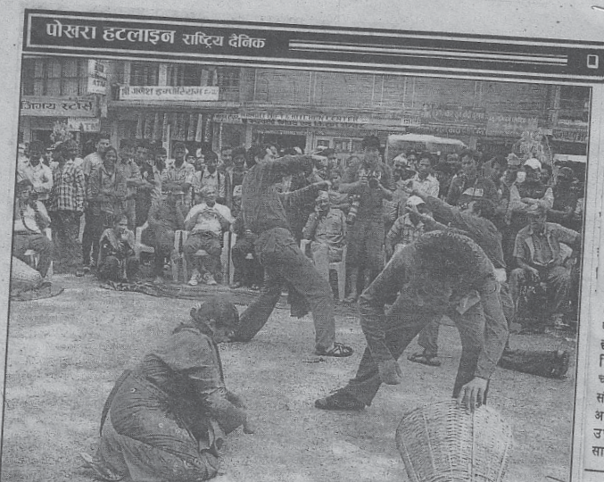
प्रकृति जोगावो : अन्तर्राष्ट्रिय जैविक विविधता दिवसको अवसरमा पोखराको चिप्लेढुंगामा आइतबार प्रस्तुत सडक नाटक। लि-बर्डको आयोजनामा मण्डपिका कला समूहका कलाकारहरूले जैविक विविधता र प्रकृति संरक्षणसम्बन्धी सचेतता दिन जैविक धुनहरू-२ नाटक प्रस्तुत गरेका हुन्।

● सडकनाटक संवाददाता पोखरा, ८ जेठ अन्तर्राष्ट्रिय जैविक विविधता दिवस २०११ को अवसर पारेर ली-बर्ड पोखराले आइतबार पोखराको मानवअधिकार चोकमा सडक नाटक प्रदर्शन गर्‍यो। नाटकमा वन पैदावार संरक्षणले मानव जीवनको अस्थित्व कायम गर्न सघाउ पुऱ्याउने विषय वस्तु समेटिएको थियो। नेपाल जैविक विविधताको हिसावले विश्वको २५ औं र एसियाको ११ औं स्थानमा रहेको छ। हिजो आज नेपालको जैविक विविधता मानव अतिक्रमणको चपेटामा परेकोले त्यसको संरक्षण र संवर्द्धन गर्न नाटकले भूमिका खेल्ने आयोजकले जनाएका थिए। उपस्थित दर्शकले नाटक समय सान्दर्भिक भएको बताए।