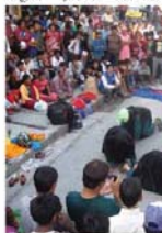
पोखरामा मंगलबार सञ्चय-नाटक देखाउँदै।

जैविक विविधताको संरक्षणमा सञ्चय संस्था लि-वर्डले समष्टिक पत्र पोखरामा कचहरी नाटकमार्फत जनचेतनामूलक अभियान चालेको छ।