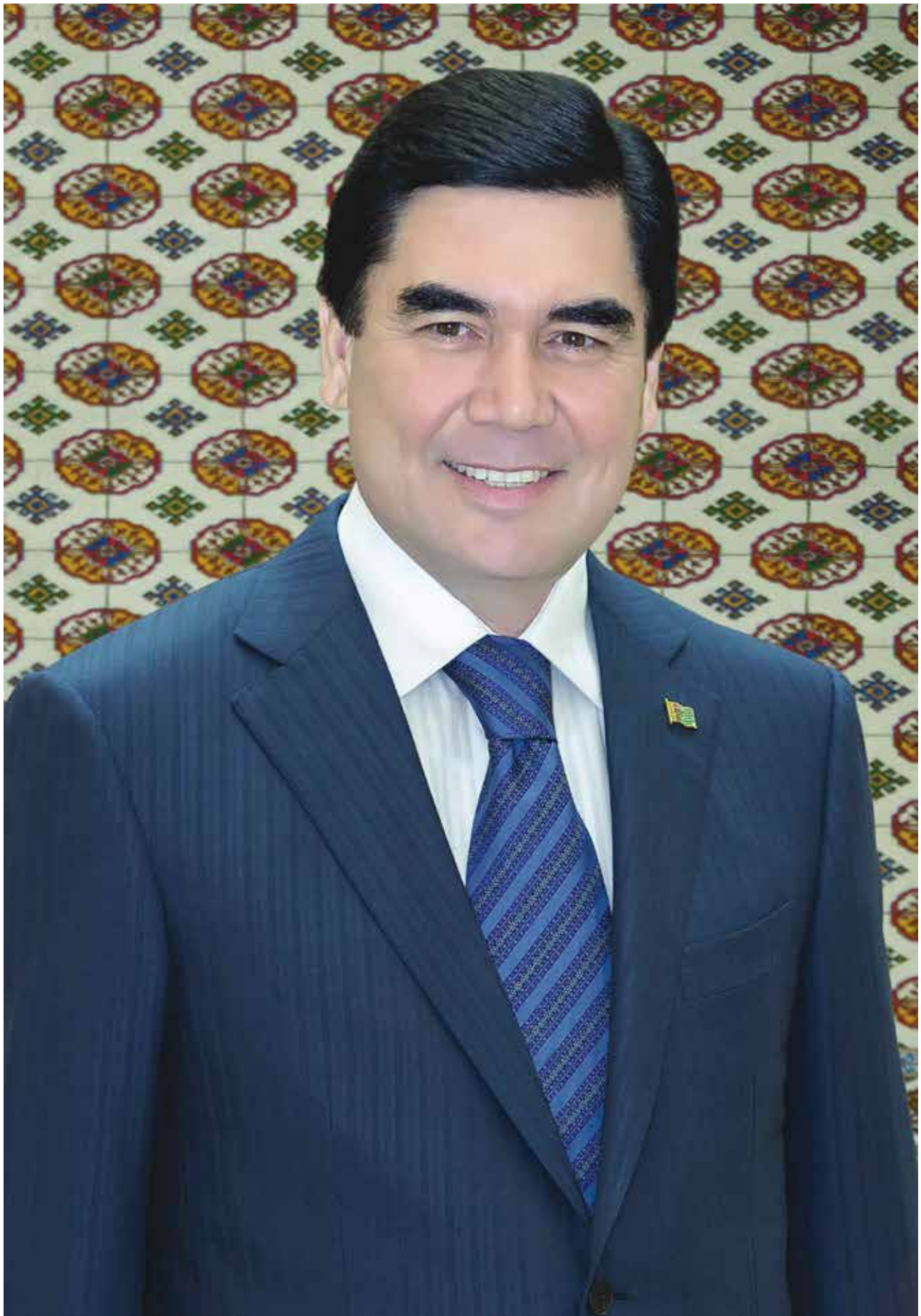
Türkmenistanyň Prezidenti Gurbanguly Berdimuhamedow