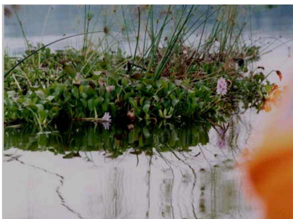
Photo 4 : Frangée de papyrus avec Eichhornia crassipes voguant dans le lac Ihema

Pour le cas du complexe Akagera/Ihema, la stabilité de l'écosystème est aujourd'hui menacée par l'envahissement par Eichhornia crassipes (Jacinthe d'eau), de telle sorte que plusieurs lacs pourraient être comblés dans un futur proche.