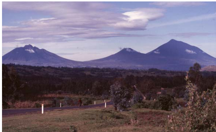
Photo 7 : Vue des volcans Muhabura, Gahinga et Sabyinyo dans le PNV et la plaine des laves

L'état de cette diversité biologique se retrouve décrit dans les chapitres traitant les thématiques sus-mentionnés.