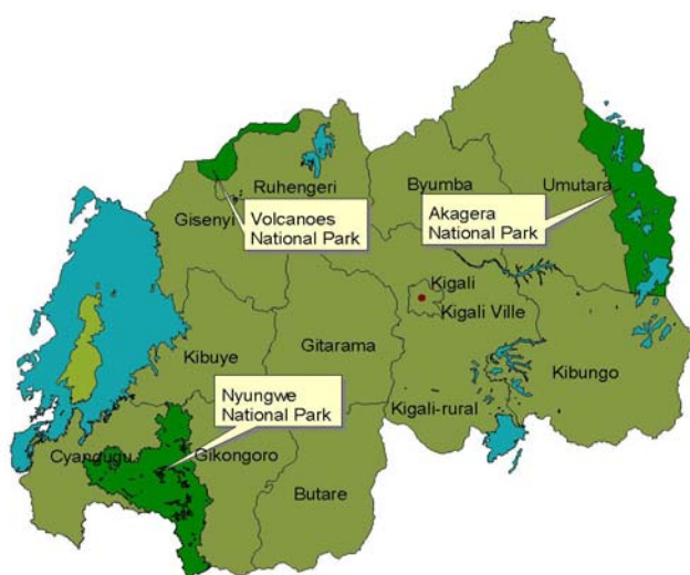
Figure 2: Localisation des trois principales aires protégées du pays

A ces aires protégées par les instruments légaux, on peut aussi ajouter des fragments de forêts tels que Gishwati et Mukura actuellement sous haute surveillance à cause des dégâts énormes dont ils ont fait l'objet et les risques de leur disparition.