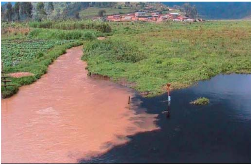
Photo 2 : Vue du Marais de Rugezi, en aval, au niveau de la confluence entre le canal principal (eau noire) et la rivière Kamiranzovu (eau rouge)

Au point de vue de la répartition, on retrouve deux types d'association végétale dans la vallée principale du marais. En amont, elle est colonisée par un tapis flottant de Miscanthus violaceus accompagné de Vaccinium stanleyi , Erica sp. et Xyris vallida . La tourbe y est généralement gorgée d'eau et n'est exploitable qu'après assèchement (Deuse, 1966). Dans la partie aval, la vallée principale est de plus en plus perturbée par l'agriculture et on y retrouve diverses cultures qui côtoient une végétation anthropique de Cyperus latifolius et Cyperus papyrus accompagnée de Juncus oxycarpus , Crassocephalum sp. , Dicrocephala sp. , Spilanthes sp. , etc.