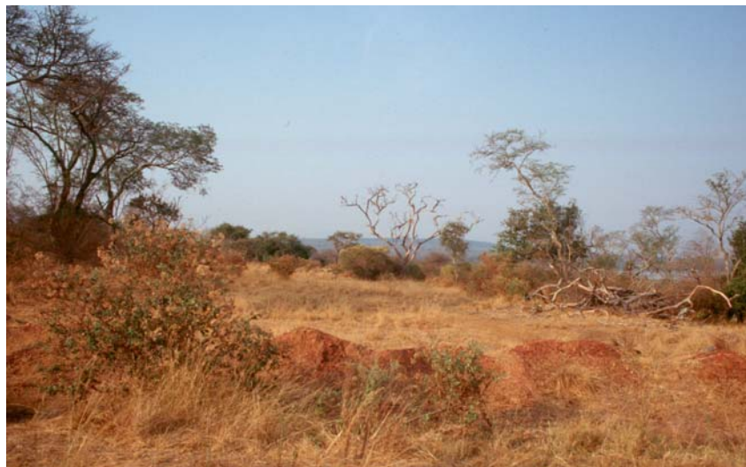
Photo 8 : Vue du Parc National de l'Akagera en saison sèche

Pour ce faire, des mesures applicables aux régions arides et sub-humides doivent également y être appliquées afin de minimiser le risque de désertification de ces régions.