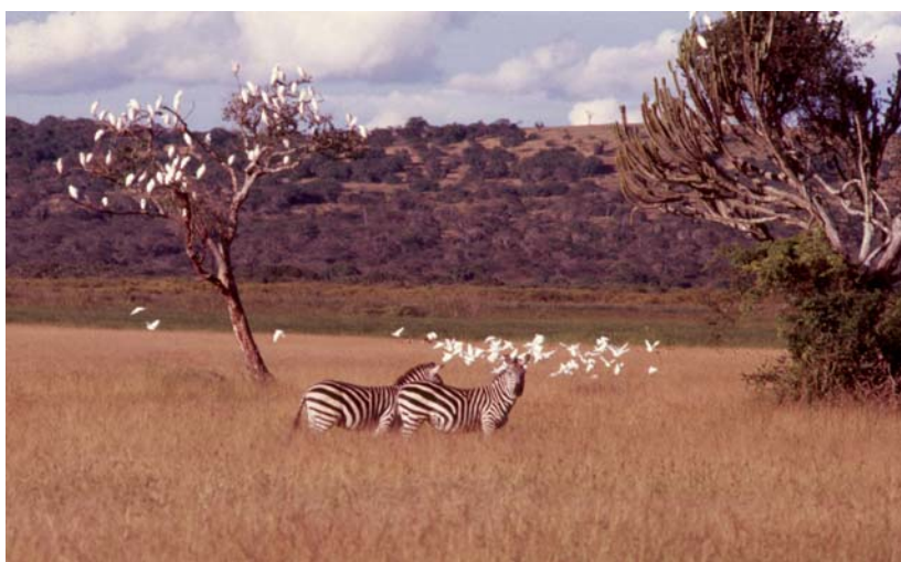
Photo 6 : Vue du PNA avec des Zèbres et des Hérons garde-bœufs dans une station de savane à Graminées

Comme d'autres écosystèmes similaires de l'Afrique orientale, ce Parc renferme de nombreuses espèces végétales et animales des savanes herbeuses, arbustives, arborées et des forêts sèches. Il abrite spécialement de fortes populations d'ongulés et quelques populations d'autres animaux dont l'inventaire reste toujours à actualiser.