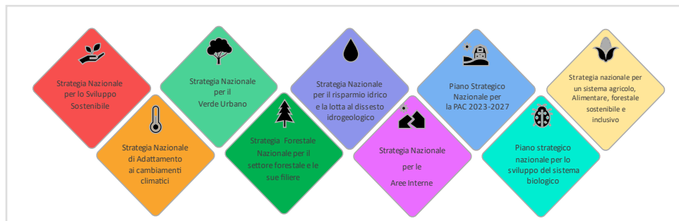
Figura 1: Principali altri strumenti strategici nazionali ai quali la SNB si integra

Inoltre, tiene conto del valore della biodiversità per il contrasto ai cambiamenti climatici, la salute e l'economia, contribuisce al raggiungimento degli obiettivi dell'Agenda 2030 e si integra ad altri strumenti strategici nazionali (fig. 1)